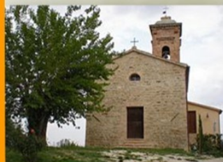
Contrada San Lorenzo